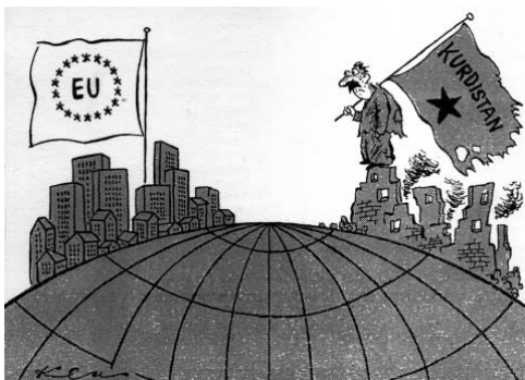
Karikatur: Klaus Becher

Mehr als vierzigtausend Menschen haben bisher im türkisch-kurdischen Konflikt ihr Leben verloren. Die meisten von ihnen waren Kurden. Immer wieder beschäftigt dieser Konflikt auch die internationale Rechtsprechung. Tausende von Urteilen des Europäischen Gerichtshofs für Menschenrechte, in denen gegen die Türkei entschieden wurde, sprechen für sich. Zahlreiche Untersuchungen und Berichte von Menschenrechtsorganisationen spiegeln nur begrenzt das Leid wieder, das die Kurden durch staatliche Gewalt und Willkür erleiden. Folter, millionenfache Vertreibung, extralegale Hinrichtungen,