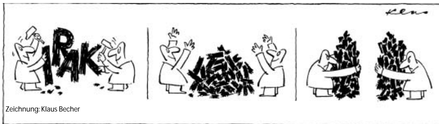
Zeichnung: Klaus Becher