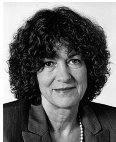
Uta Zapf (SPD)

Insofern glaube ich, dass eigentlich die Bundesrepublik eine Politik betreibt, dieser Organisation und damit den Organisationen der Kurden, die man ja nicht immer vollständig trennen kann von den Aktivitäten der PKK, genügend Freiheit zu geben, in der Bundesrepublik sich zu engagieren, solange eben dieser Aspekt berücksichtigt wird, dort keine Unruhe zu machen und dass man auf der anderen Seite an die Frage des Verbotes schlicht und ergreifend aus Rücksicht gegenüber der Türkei nicht herangeht. Also man